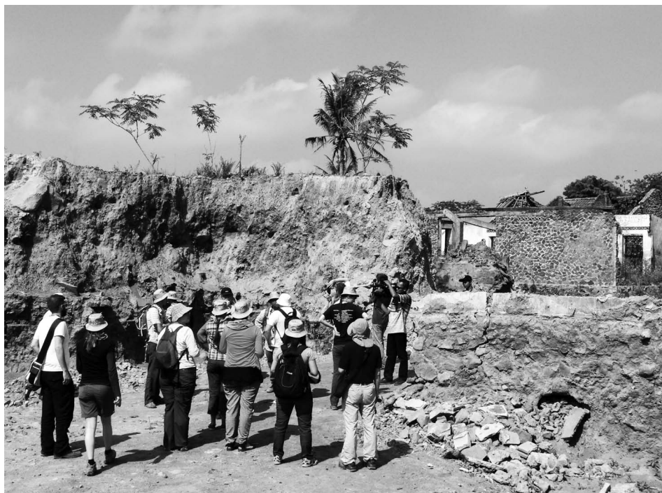
4. ábra • Bakalan falu egyike a Gendol-folyó völgyében blokk- és hamuárak által elborított településeknek.

A Merapi lahareseményeiről, melyek a vulkán főként délnyugati lejtőin futnak le akár 25–30 km távolságba, a XVI. század óta vannak feljegyzések. A 2010-es kitörés nyomán mintegy 130 millió m^3 elsődleges vulkáni törmelék rakódott le, és ennek legalább 35%-át laharok mosták le (Surono et al., 2012),