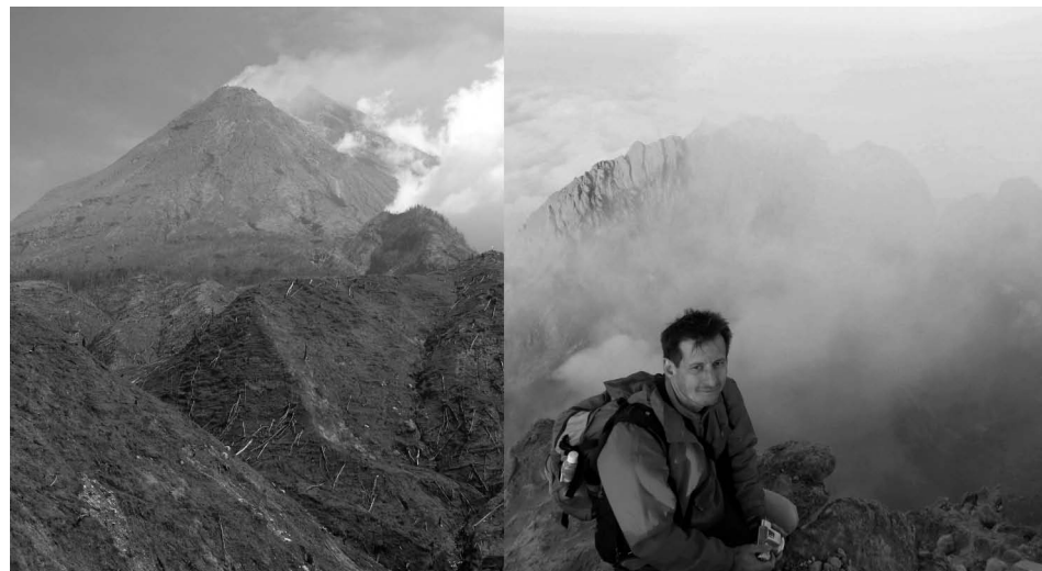
1. ábra • Balra: a Merapi látképe dél felől; jobbra: az állandó fumarolaaktivitást (gázkiáramlást) mutató csúcskráter a 2010-es kitérés után (2014. szeptember 12.)

A Gunung Merapi (2968 m) egyike Jáva legszembetűnőbb, leglátványosabb vulkánjainak (1. ábra). A Yogyakarta várostól 25 km-re lévő kúp alsó lejtői és törmelékcsúcsa – mintegy 40 km-es körzetben – másfél millió embernek ad otthont. A vulkán gyakori kitérésai ennek legalább harmadát állandó veszéllyel fenyegetik (Thouret et al., 2000). A pipáló tűzhányó, mely mintegy a város jelképe, főként kora reggel és napnyugtakor fedi fel magát, és a nem messze lévő, naponta turisták ezrei által látogatott Borobudur (UNESCO Világörökség) buddhista templomából is páratlan látványt kínál.