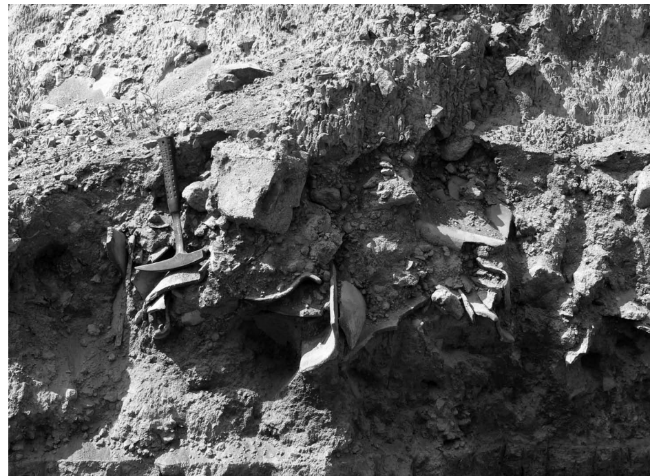
5. ábra • Blokk- és hamuár üledékanyagának közeli képe cseréptöredékekkel (Bakalan falu).

Az áldozatok többségét a forró gázfelhő ölte meg. Noha ennek hőmérséklete viszony-